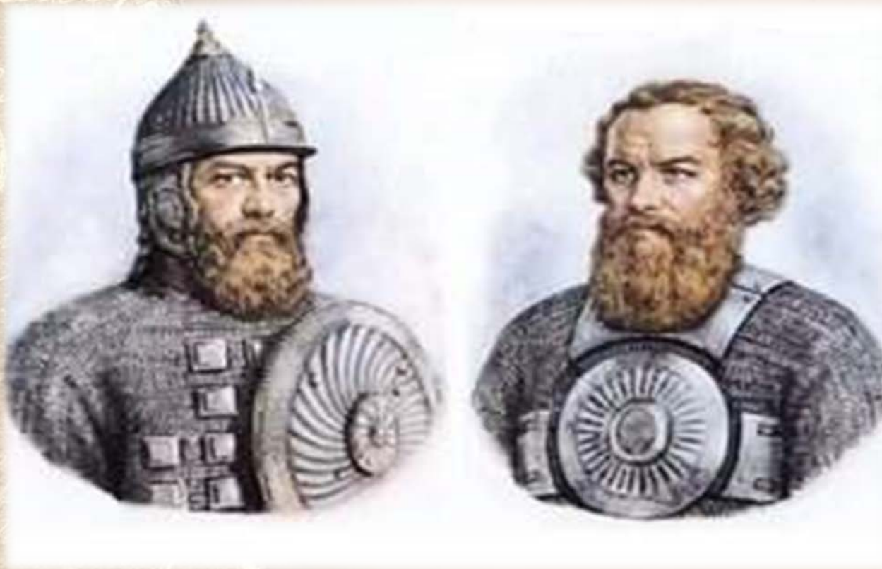
Посадский человек Кузьма Минин.

Центром нового освободительного движения стал Нижний Новгород.