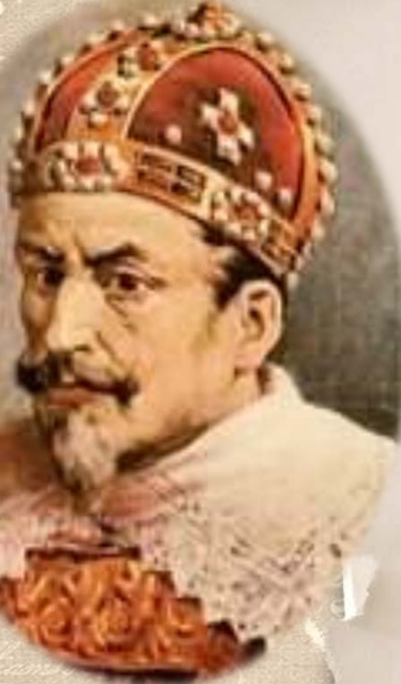
Король Речи Посполитой Сигизмунд III

К 1611 г. Москва была занята польским гарнизоном, который фактически захватил власть в столице. Король Речи Посполитой Сигизмунд III из-под осаждённого им Смоленска отдавал от своего имени распоряжения всей России и удерживал в плену великое посольство из лучших московских людей, которое было направлено к нему, чтобы просить на царство его сына Владислава..